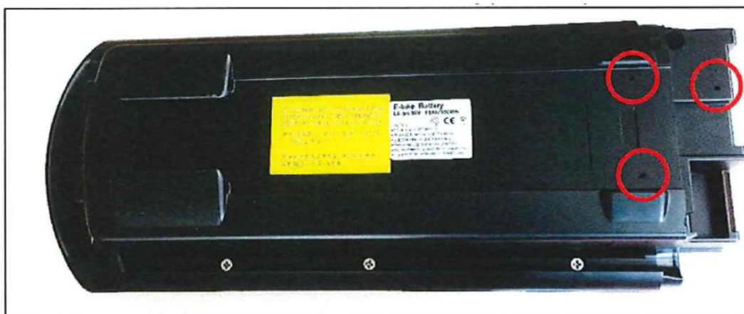
Image 3 : Batterie iBike de support arrière modifiée (orifices d'évacuation)

Votre attention est attirée sur le fait que, dans le but d'accélérer le remplacement des batteries potentiellement affectées, SUNSTAR a modifié un certain nombre de batteries iBike de support arrière existantes pour en assurer la sécurité. En conséquence, il est possible que certaines batteries iBike de support arrière fournies en remplacement aient un numéro de série correspondant aux numéros de série affectés. Néanmoins, ces batteries modifiées ne sont pas affectées par cette mesure de rappel de produits et peuvent être identifiées visuellement par les 3 orifices d'évacuation réalisés sur la face inférieure des batteries (cf. image 3). Veuillez noter que les modifications effectuées sur les batteries affectées par cette mesure de rappel de produits incluent également le scellage de la batterie ainsi que d'autres modifications techniques internes et pas seulement l'addition d'orifices d'évacuation.