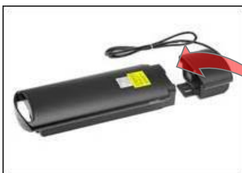
Image 2 : Étiquette du numéro de série de la batterie iBike de support arrière